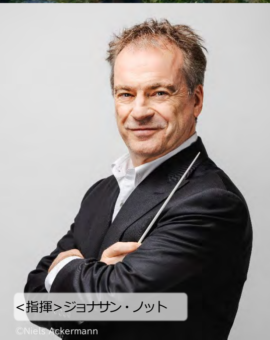
<指揮>ジョナサン・ノット