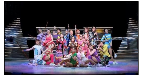
【劇団四季 The Bridge(令和3年)】

県内の文化芸術振興において鑑賞機会の提供及び鑑賞者の育成は不可欠であり、そのためにもより優れた舞台公演鑑賞の機会を県民に提供していくことが重要であるため、民間機関が実施する公共性の高い優れた鑑賞事業に対し、当財団が共催することで県民の鑑賞機会を増やすことを目的とします。