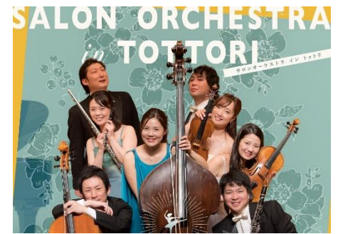
【SALON ORCHESTRA in Tottori(令和3年)】

一般団体（芸術団体・文化芸術関連NPO団体など）が実施する優れた鑑賞公演について当財団が共催することで、財団のミッションの一部でもある「団体の自主的な活動の支援」として、県民に優れた文化芸術公演を多く提供し、鑑賞機会を増やすことを目的とします。