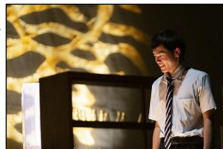
【U-18シアタープロジェクト(平成31年)】

鳥取県内の18歳以下が創作した戯曲を同じく県内18歳以下が演じる、新作オリジナル作品の演劇公演を制作し上演します。過去に取り組んだ演劇創造事業で育成した人材を講師として起用し、地域においてさらなる人材育成と後進の発掘・育成を図り、県内における新たな演劇の発展と発信を目指す演出指導者として、新国立劇場演劇研修所所長の宮田慶子氏を引き続き起用します。併せて、課題（財団スタッフのプロデュース力向上、活動者の活性化、次世代育成等）の改善を目指し、活動者及び関係者とのネットワークづくりに取り組みます。